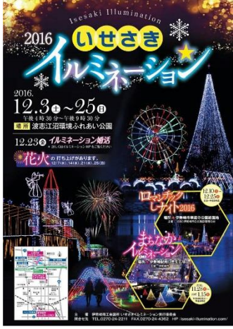
2016いせさきイルミネーション http://isesaki-illumination.com/

2016.12.1 2016 いせさきイルミネーション 発行元 小久保運送有限会社 0270-32-1542